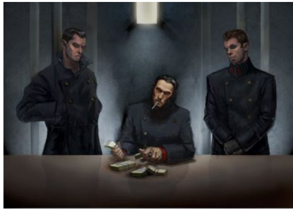
Ses gardes du corps l'abandonnèrent à deux hommes de la Main Noire ...

« J'espère que ces fous du GDI ne t'exécuteront pas, nous avons tellement à apprendre l'un de l'autre. »