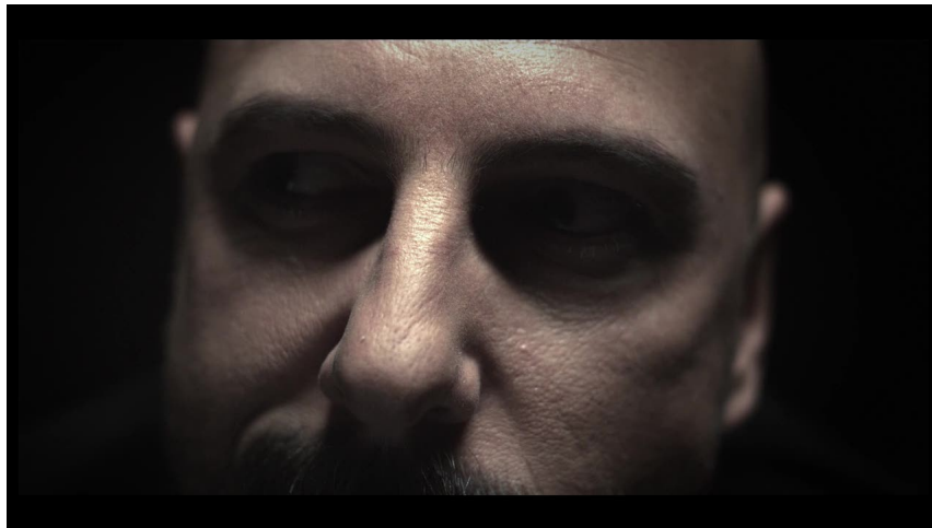
Seuls ses yeux trahissaient sa colère et son envie de meurtre ...

- A partir d'aujourd'hui, le Nod et le GDI sont alliés.