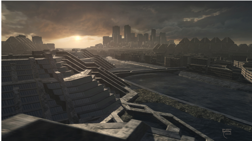
Le Quartier général GDI de Washington